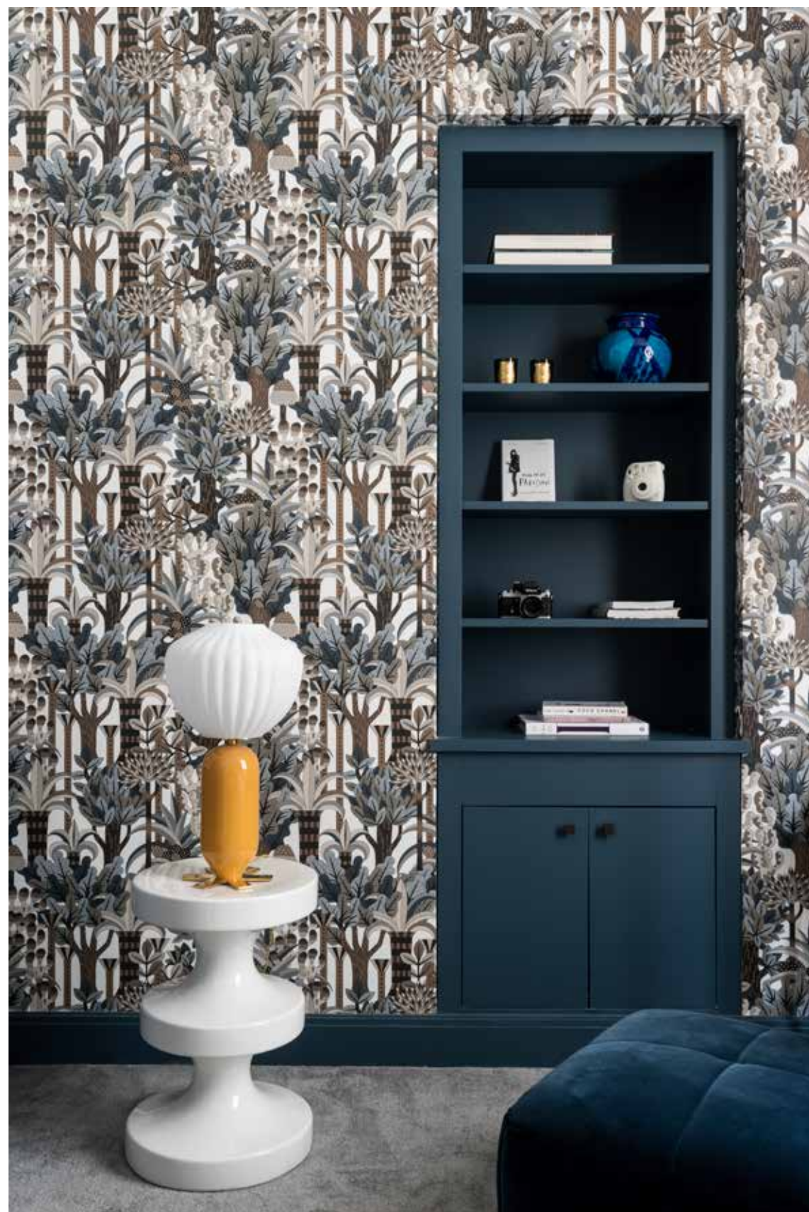
Behang Jardin d'Osier van Hermès, kruik Bishop en lamp Don Giovanni van India Mahdavi, poef Strips van Cini Boeri voor Arflex. De ingebouwde wandkast en de plinten zijn geverfd in de kleur Stiffkey Blue van Farrow & Ball