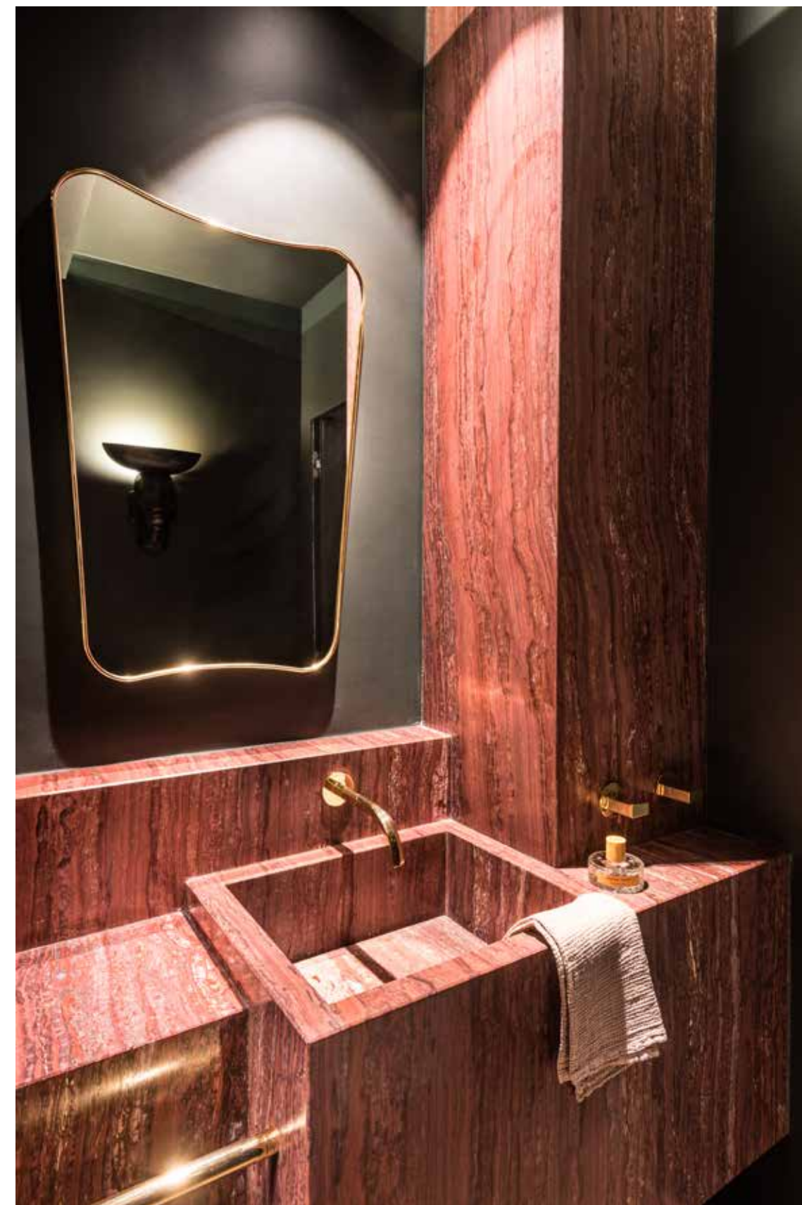
Rood marmer alom in een van de badkamers, met kranen van het Italiaanse merk Fantini en de spiegel FA. 33 van Gio Ponti, heruitgegeven door Gubi